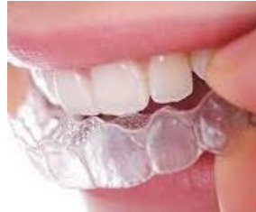
Clear Overlay Retainer (essix) 0.75/1.0/1.5/2.0mm