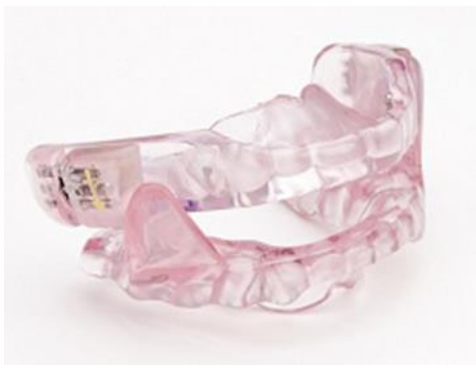
Mandibulair Repositie Apparaat (MRA)